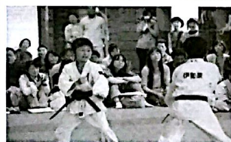
各種目協会 活動の様子